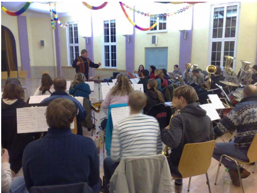
Gesamtprobe des Landesblasorchester im Februar 2008 in Dittrichshütte