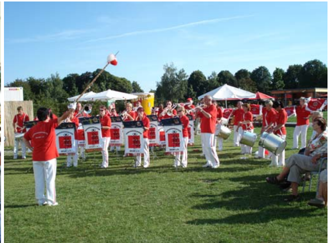
Gemeinschaftskonzert auf der BUGA 2007