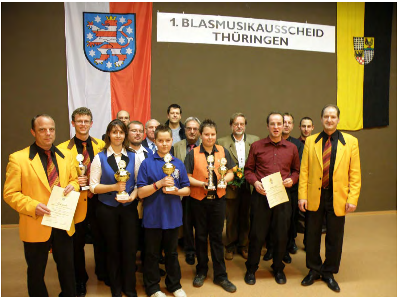
Preisverleihung, Blasmusikwettbewerb in Untermaßfeld