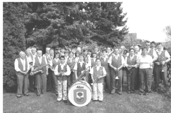
Gruppenfoto von 2009

40 Jahre Vereinsbestehen muss einfach groß gefeiert werden. Die Vorbereitungen werden zwar in diesem Jahr bereits beginnen, jedoch erst in einem späteren Bläserecho werdet Ihr davon wieder hören und wir freuen uns schon jetzt auf Euren Besuch – und vergessen die Instrumente nicht.